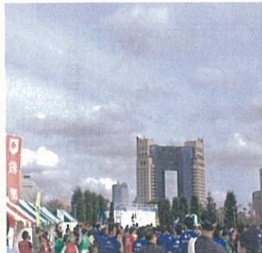
開会式が行われた中央広場