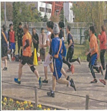
快走する徳さん<中央手前>

しかし当日の足のコンディションは、80〜90%でした。走り始めて序盤は好調なスタートでしたが、去年苦しめられたアップダウンが激しい所では、ペースも落ち、かなり苦戦しました。それでも、FDAのスタッフさんや利用者さんの応援を糧に、第一走者としての役割を全うし最後まで走りきりました。完走した後FDAのスタッフさんや利用者さん、そしてFDAを卒業された方などから、おめでとうやお疲れ様などの言葉を頂きました。